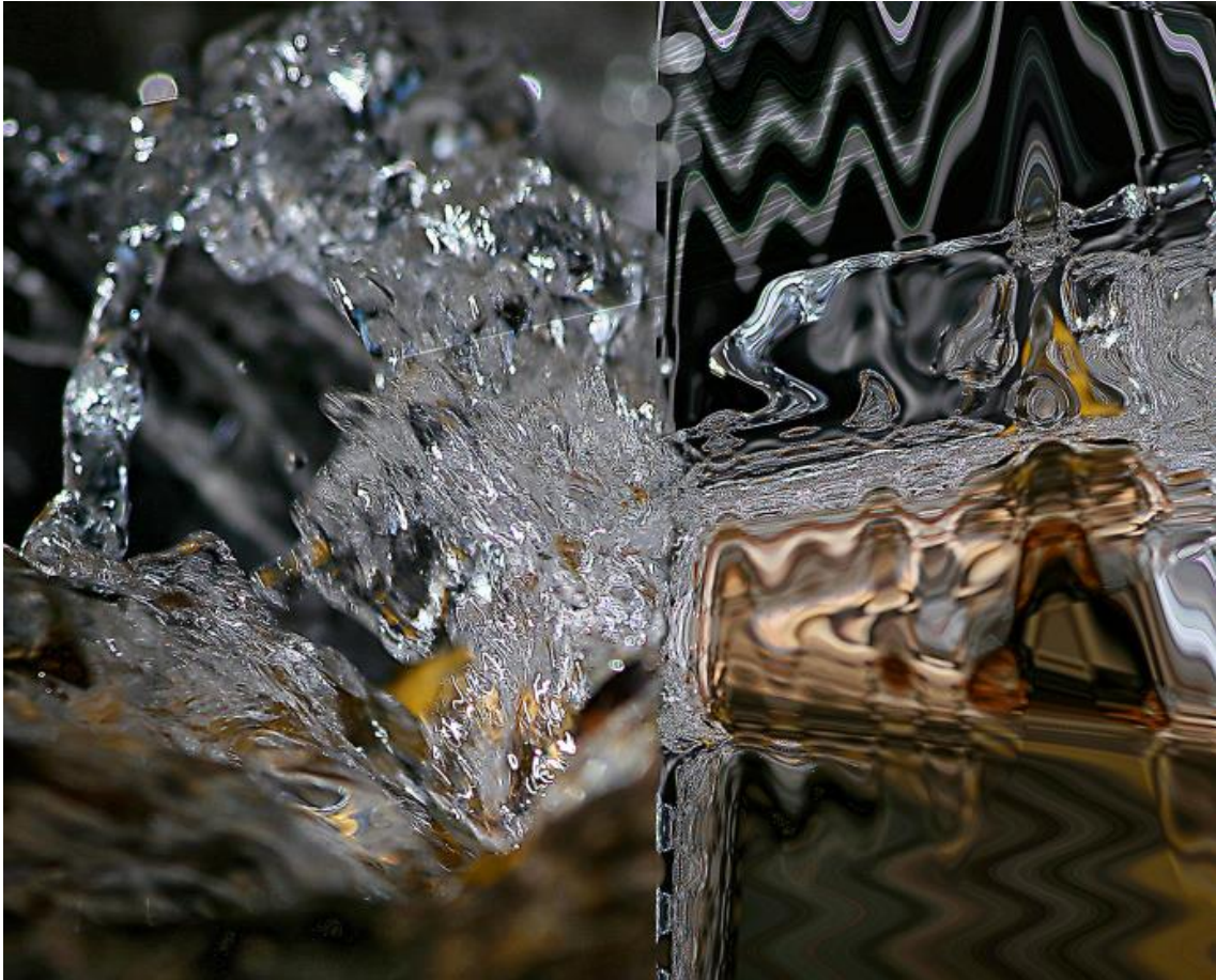
Fig. 7. José María Marbán: Underwater V , 2016, Impresión de pigmentos minerales sobre papel de algodón montado sobre aluminio, 50 x 62 cm.

Las formas orgánicas generadas de manera natural por las corrientes de agua son una suerte de “dibujos automáticos”, formados por gotas de agua a gran velocidad, y son definidos así por el propio artista: “recorren una caprichosa trayectoria en un corto espacio de tiempo, suficiente como para dibujarla en el sensor de la cámara, formando así la apariencia de abstracción cuando en realidad no lo es”. El interés que generan estas formas en el artista es una evolución de su gusto por la abstracción lírica, la cual subyace en las estas imágenes técnicas de Marbán. Pero, si continuamos buceando en la capa sedimentaria de estos trabajos, encontramos referencias que preceden (y, en cierta medida, anticipan) la abstracción, como son las obras de William Turner. Las furiosas tormentas marinas representadas por el pintor inglés fueron en su momento una ampliación del campo pictórico, ya que su plasmación del turbulento sentimiento romántico adelantaba las tendencias no-figurativas desarrolladas por el arte de vanguardia del siglo XX.