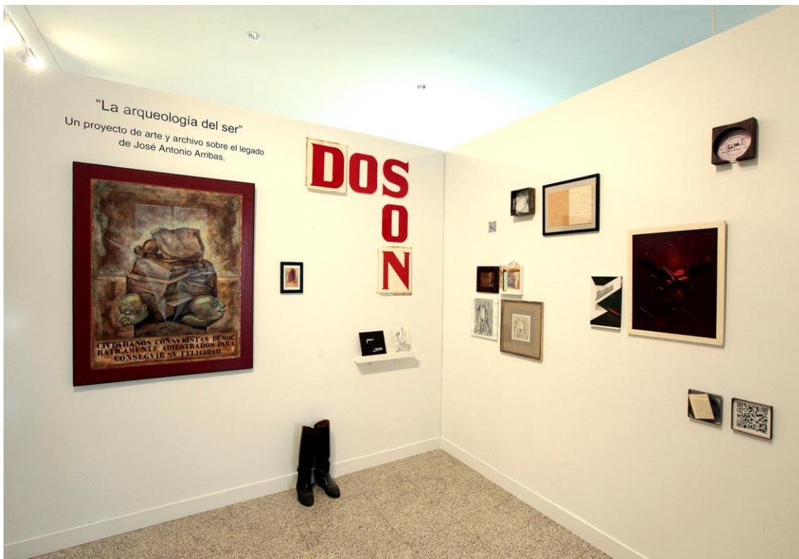
Fig. 4. Vista de 9 de nueve , exposición colectiva de los proyectos ganadores de las primeras becas de creación artística de la Fundación Villalar-Castilla y León. Cortes de Castilla y León, Valladolid, 2018.

Hay una parte de mí, una parte que es reliquia; cuando me muera habrá reliquias en los museos y estas reliquias son de por sí ya objetos un poco muertos. (...) Y además, tal vez habrá obras para reinterpretar, como una partitura musical que alguien deberá interpretar de nuevo. (...) Hago un trabajo de creación cada vez que hago una exposición. Cuando esté muerto, hará falta alguien que haga este trabajo de creación, hará falta alguien que reinterprete. Actualmente, soy yo quien interpreto mi trabajo, pero cuando esté muerto hará falta alguien que lo haga. Pero es así para todos los museos, cuando ustedes cuelgan un cuadro en la pared ya hacen una reinterpretación. Interpretan el trabajo de cualquiera solo con mostrarlo 4 .